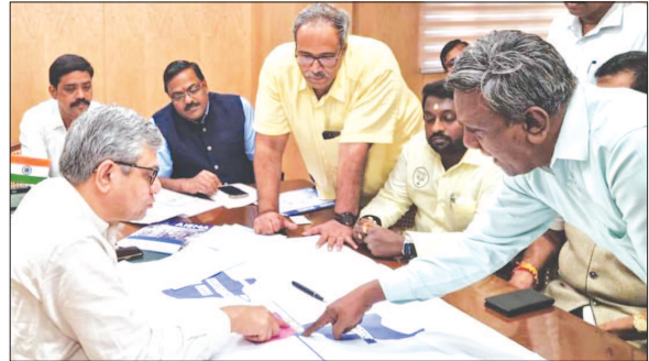
LUB's Tamil Nadu Team Discussed Developmental Agenda with Union Minister for Railways & Communication Shri Ashvini Vaishnav.