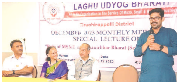
LUB's Tiruchirapalli District Unit conducted a Monthly Meeting and Discussed Agenda for the Forthcoming Month at Trichy on 18th December, 2023.