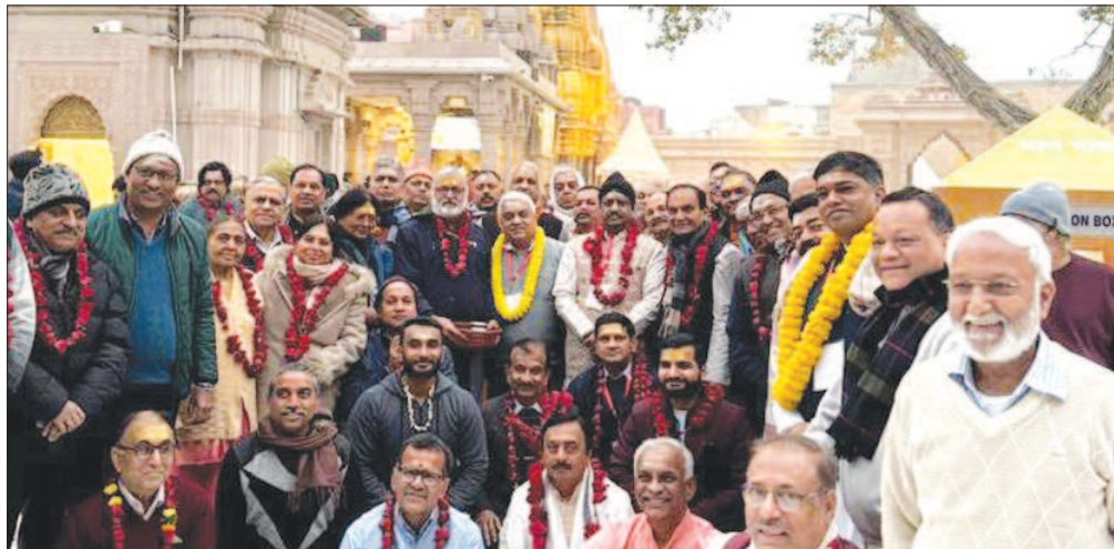
All Members visited Shri Kashi Vishwanath Temple during Two Day Meeting of National Working Committee held at Varanasi on 29-30 December, 2023.