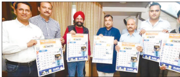
Union Minister for Road Transport and Highways Shri Nitin Gadkari released the New Year Calendar produced by LUB's Nagpur Unit.