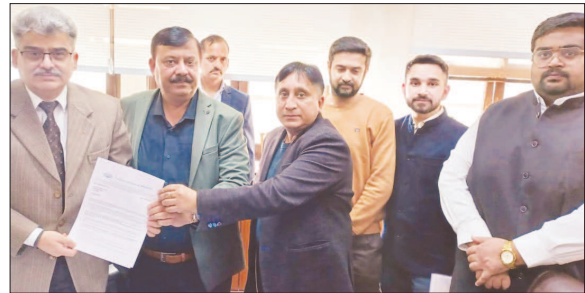
A Delegation of Laghu Udyog Bharati J&K met Chief Secretary to Extend Warm Wishes and apprises him about the Hindrances in the Growth of Industries in the State.