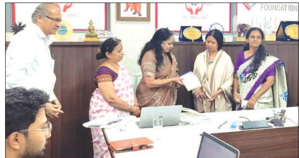
LUB's Women Cell of Karnataka State Unit Discussed on Women Entrepreneurship and Skills Development.