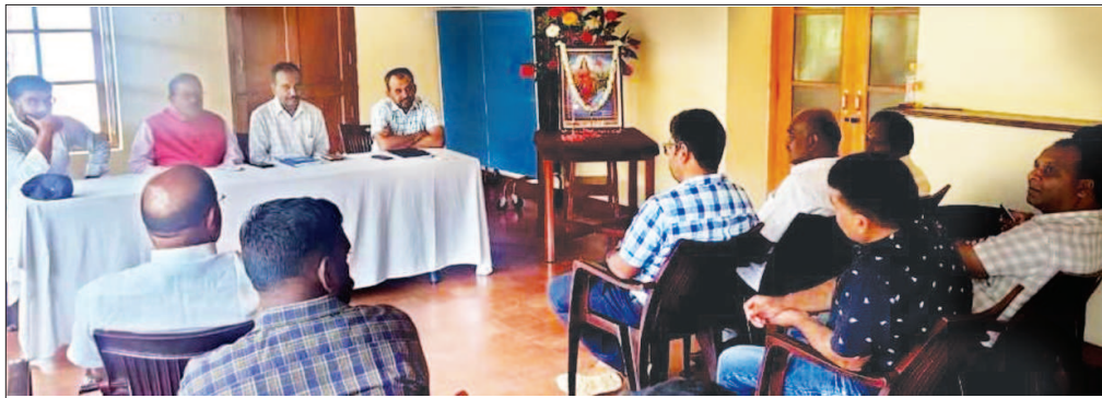
LUB's Nilgiri District Unit of Tamil Nadu State conducted its EC Meeting on 12th June, 2023.