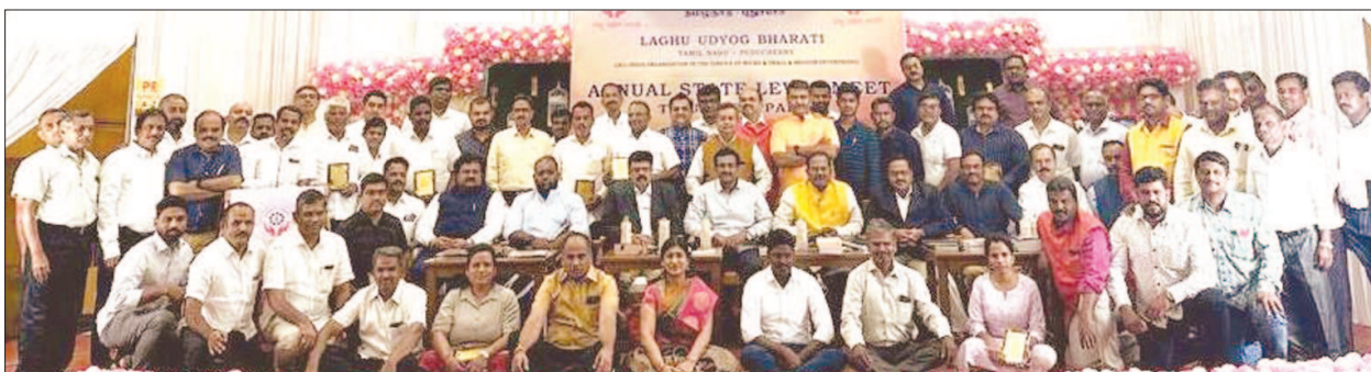
LUB's Tamil Nadu Unit conducted an Annual State Level Meet with 25 Office Bearers, State EC Members and National Leaders.