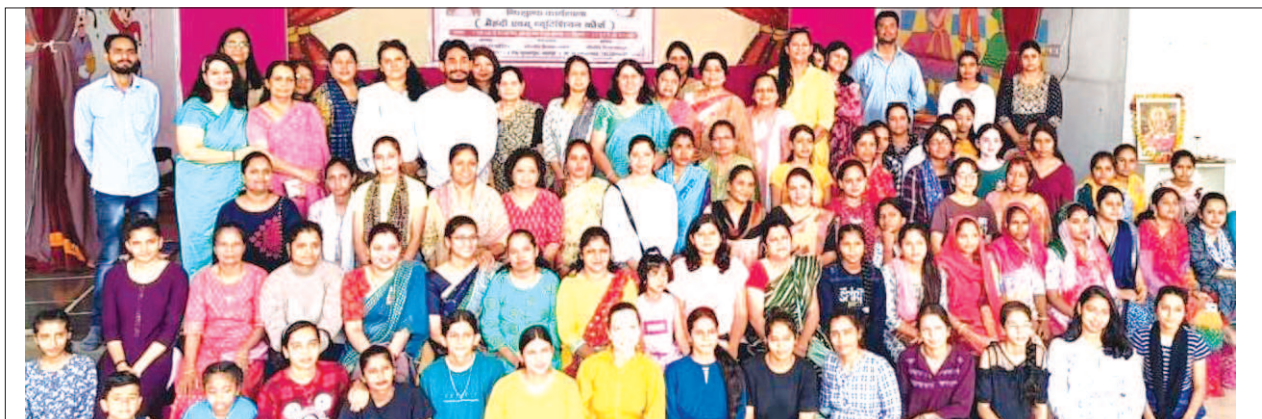
LUB's Udaipur Women Wing Initiated a Training Course on Beautician and Mehendi on International Yoga Day on 21st June, 2023.