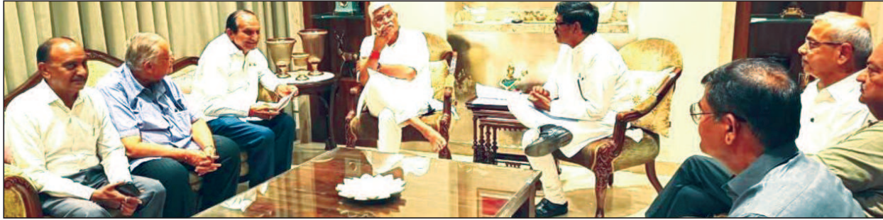
A Delegation of Textile Manufacturers led by LUB's National General Secretary Shri Ghanshyam Ojha met Union Minister Shri Gajendra Singh at Jodhpur.