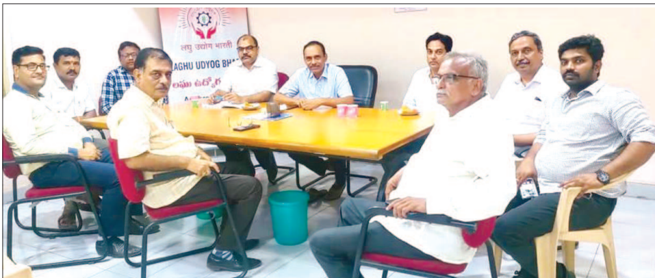
LUB's New Unit was formed at Vishakhapatnam.