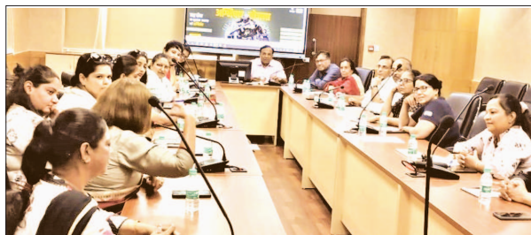
LUB's Delhi Unit organized a Discussion on Agniveer Scheme initiated by Govt. of India on 5th July, 2022.