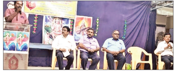
LUB's Tamil Nadu State Officials Inaugurated New District Unit at Chengalpattu & Allocated Work to Team Members on 18th July, 2022.