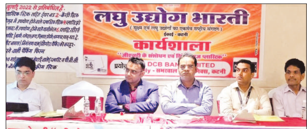
LUB's Katni Unit of Madhya Pradesh State organized a Seminar on Recent Amendments in GST.