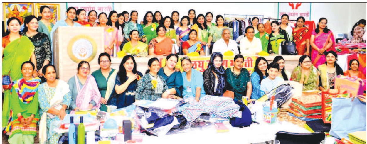
Swayam Siddha Exhibition was organized by LUB's Women Wing Jodhpur Unit of Rajasthan State with 40 stalls on 26th July, 2022.