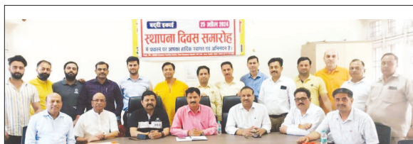
LUB's Baddi Unit of Himachal Pradesh Felicitated Veteran Members & Entrepreneurs on the Occasion of Foundation Day.