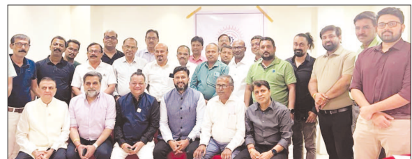
LUB's Team had an Interaction with Local Industry Persons at Agartala and got Good Response for Initiating Process of Formation of Tripura State Unit.