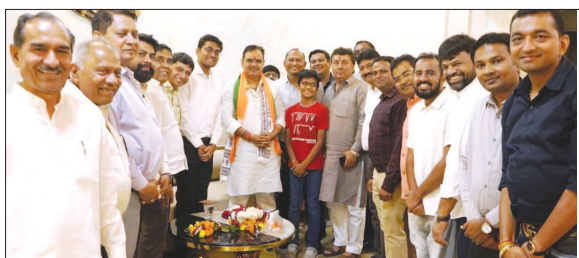
LUB's Office Bearers and Local Entrepreneurs with Chief Minister Rajasthan Shri Bhajan Lal Sharma on arrival at Jasol Balotara.