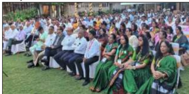
Industry leaders participating in the Conclave at Belagavi

decentralised Model whereby, he suggested that there should be industrial development pan India and not restrictive to certain pockets of the nation. Indicating that while Bengaluru or Belagavi are important, remote and backward states like Bihar, Assam or UP should receive equal attention as far industrial development is concerned. He also spoke on IR and HR relations and made a clarion call to preserve and protect culture and traditional ethos diversity in India. On this occasion; a souvenir was also launched which has captured some of the renowned industry captains of Belagavi who have so arduously built the brand equity for Belagavi. In this coffee table book they have shared their comprehensive thoughts on their business journey which will come handy to the aspiring entrepreneurs.