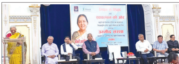
LUB's Lucknow Unit Donated Rs. 8 Lac to the Ummeed Sanstha for running Smart Classes for Marginalised Children in the presence of Governor Uttar Pradesh Smt. Anandi Patel at Lucknow on 12th April, 2024.