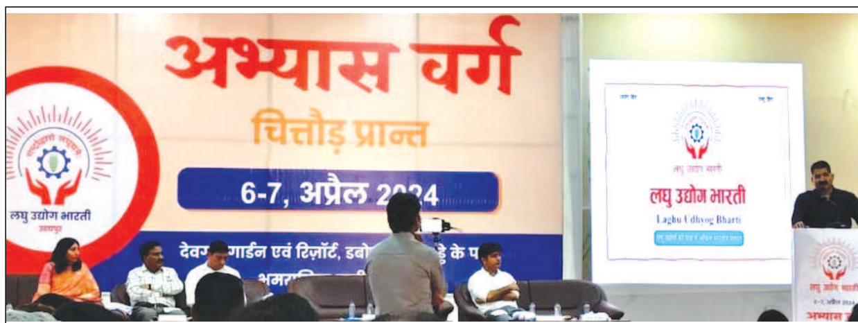
Minister for ST Development Shri Babulal Kharadi, MoS Industry Shri KK Bishnoi and LUB's National Leadership attended a Two Day Abhyas Varg of Chittaur Prant at Udaipur on 6 & 7 April, 2024.