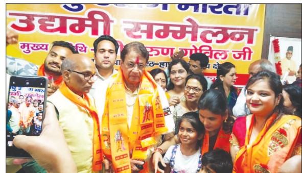
Veteran Artist Shri Arun Govil attended a Public Awareness Program organised by LUB's Meerut City Unit on 13th April, 2024.