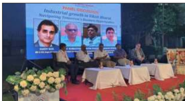
Top Belagavi industry Captains at the Panel Discussion

LUB-Karnataka hosted the All India Working and Executive Committee Meeting (AIWEC) at Belagavi.