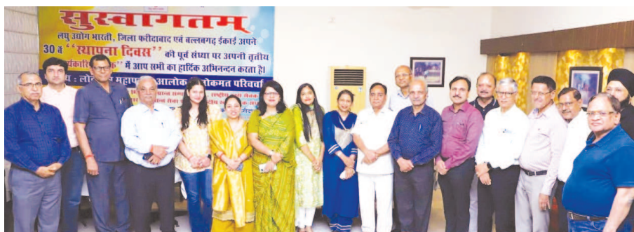
LUB's Faridabad-Ballabgarh Unit of Haryana State Celebrated Foundation Day and organized a Special Session on Responsible Citizen and Democracy.