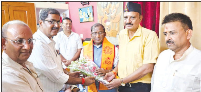
A Meeting of Entrepreneurs of Kashi Sambhag (UP) was held with Assam Governor Shri Lakshman Acharya on 23rd August, 2024.