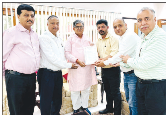
LUB's Chandigarh Delegation Welcomes New Governor of Punjab Shri Gulab Chand Kataria and Discussed the Industrial Scenario.