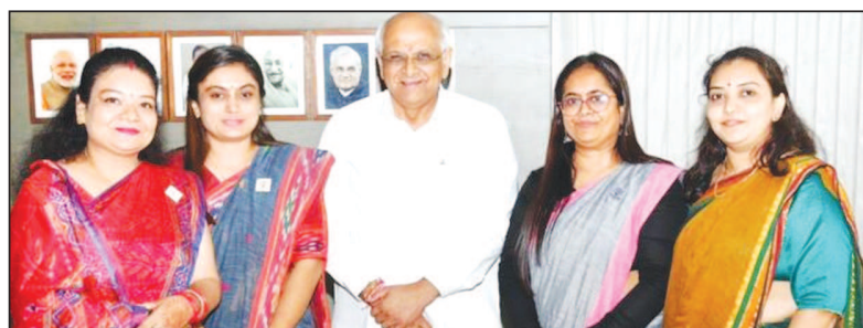
LUB's Gujarat Women Wing Members Celebrated Rakshabandhan Festival with Chief Minister Shri Bhupendra Bhai Patel at Gandhi Nagar.

A Round Table Meeting was conducted by the Reserve Bank of India for MSMEs. Representation was handed over by LUB's Delegation to the RBI Director.