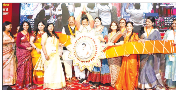
LUB's Women Wing Members of Madhya Pradesh tied Rakhi to Chief Minister Dr. Mohan Yadav during Women Udyami Sammelan on 13th August, 2024.