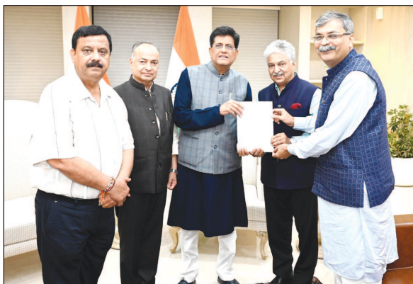
LUB's J&K State Unit & LEAD Delegation Meets Union Minister of Commerce & Industry Shri Piyush Goyal for Investment Package Expansion & NCSS.