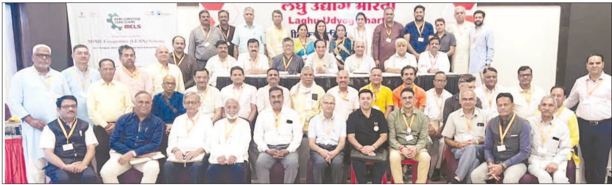
All India Working & Executive Committee Meeting was Conducted in the presence of Top Leadership at Dewas, Madhya Pradesh on 5-6-7 August, 2024.