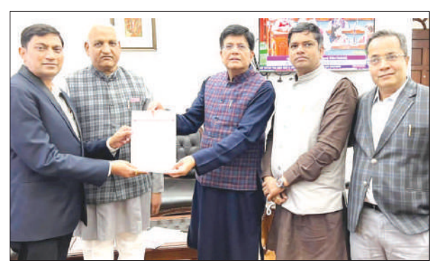
Delegation of LUB's Bhilwara Unit headed by National Organizing Secretary Shri Prakash Chandra met Union Minister for Textile Shri Piyush Goyal at New Delhi. National Secretary Shri Naresh Pareek is also seen with other officials.